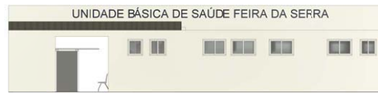
2 FACHADA 1:50