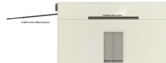
4 CORTE C-C 1:50