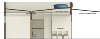
3 CORTE B-B 1:50