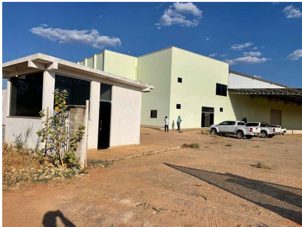
FOTOGRAFIA 1 -