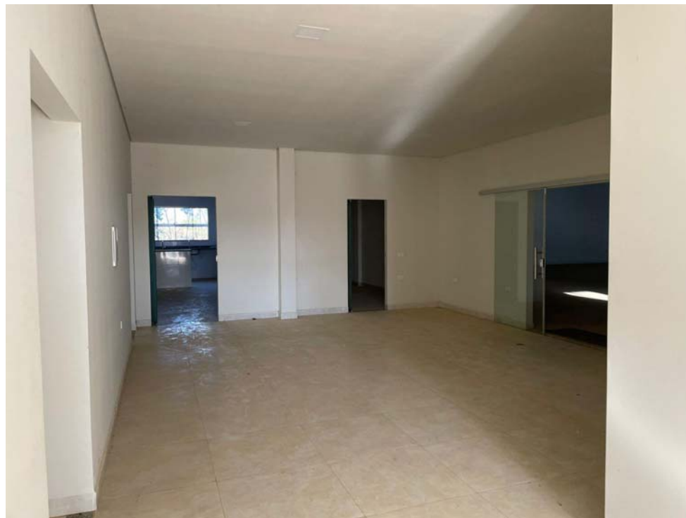
SALAS DE ESCRITÓRIOS