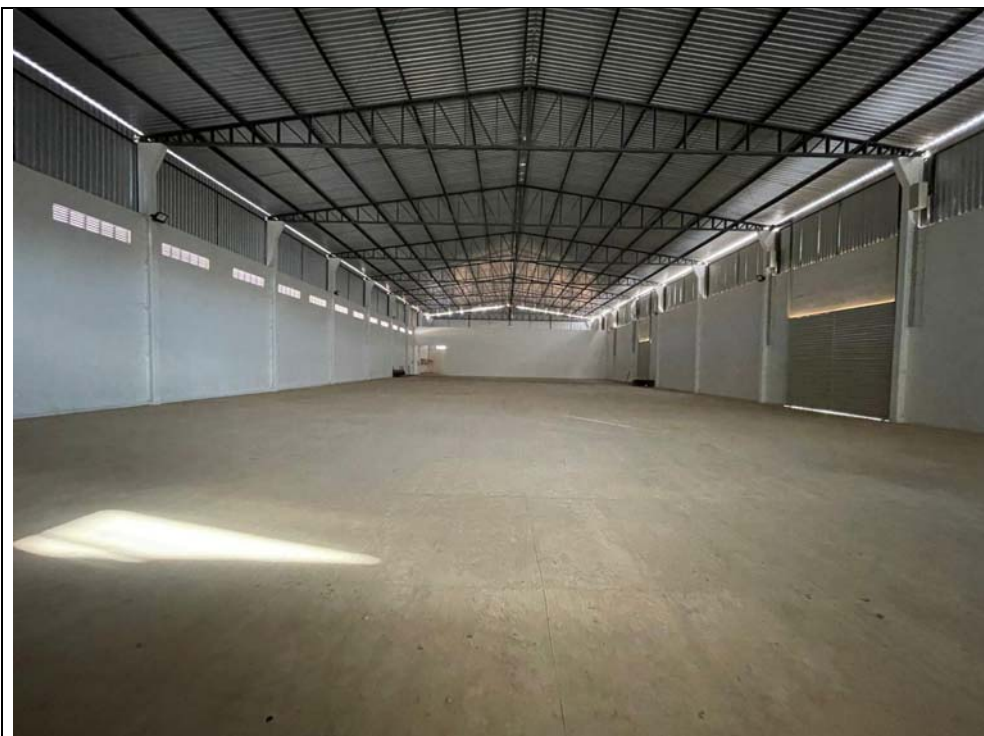
GALPÃO DE ARMAZENAMENTO